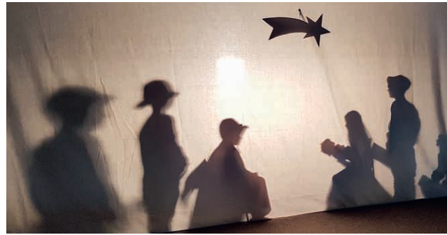
Krippenspiel als Schattentheater.

Dienstag, 24. Dezember, 15.30 Uhr, Kirche St. Agatha Kleinkinderfeier mit Krippenspiel als Schattentheater, gespielt von Kindern.