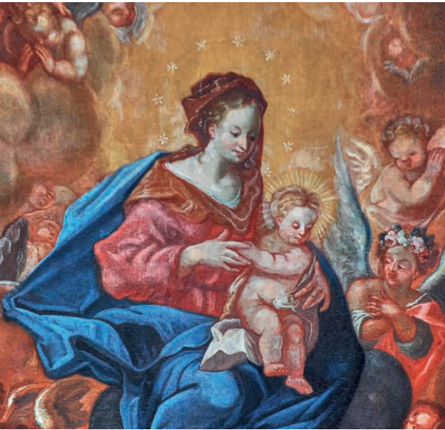
Maria mit Kind, Hochaltar Pfarrkirche.