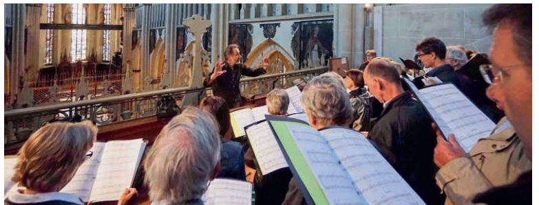
Mit dem Chor in der Kathedrale Freiburg.