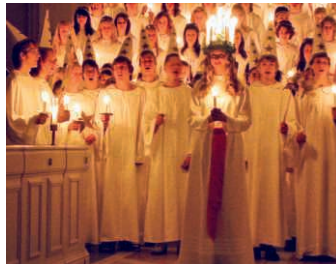
Das Luziafest ist in Schweden sehr beliebt.

Die Legende erzählt, dass Luzia ihre Mitgift den Armen austeilte und nachts den verfolgten Christen Lebensmittel brachte. Damit sie beide Hände mit Gaben füllen konnte, befestigte sie auf ihrem Kopf ein Öllämpchen, das ihr den Weg zeigte. Sie starb unter Kaiser Diokletian am Beginn des vierten Jahrhunderts als Märtyrerin.