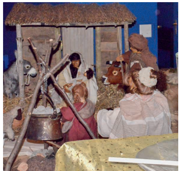
Krippe in der Kirche St. Agatha Buchrain.

Das Friedenslicht aus Bethlehem kann in der Pfarrkirche bei der Krippe mit eigener Kerze oder Laterne abgeholt werden.