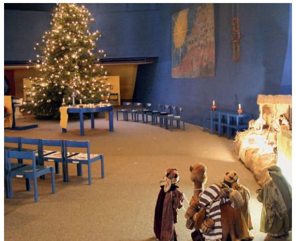
Kirche St. Agatha Buchrain.