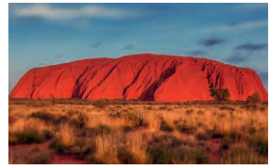
Der Uluru (Ayers Rock) liegt im Herzen Australiens.

Mehr als 500 Vertreter staatlicher und kirchlicher Schulen sowie aus Fachverbänden haben in Ungarn an einer grossen Kinderschutz-Tagung der Benediktiner-Erzabtei Pannonhalma teilgenommen. Das berichtet der Nachrichtendienst östliche Kirchen NÖK. Ziel der Tagung Mitte Oktober sei es gewesen, «alle zu ermutigen, die Wahrheit ohne Wenn und Aber auszusprechen. Anstatt die Fassaden aufrechtzuerhalten, muss man sich auf die Kinder konzentrieren», betonte laut NÖK Pater Konrad Dejsics von der Abtei Pannonhalma.