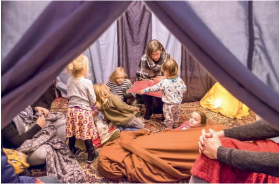
Erzählzelt in der Pfarrkirche Root.