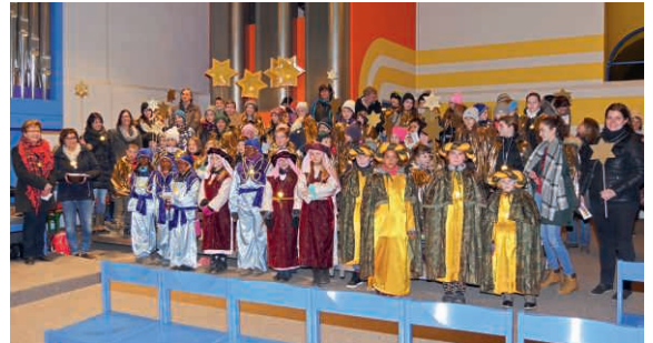
Sternsinger in der Kirche St. Agatha Buchrain.

Die Sternsinger, begleitet von den heiligen drei Königen, tragen Gottes Segen und Frieden zu den Menschen in Buchrain. Unter dem Motto «Kinder helfen Kindern» unterstützen sie dieses Jahr Friedensprojekte von Kindern im Libanon.