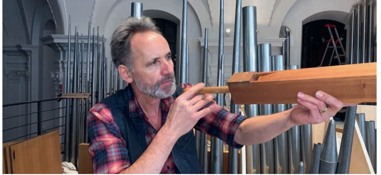
Auf der Orgelbaustelle in der Pfarrkirche Ebikon.

Dass die Musik auch optimal zur Liturgie passt, das war mir stets ein Anliegen – während meiner Arbeit am Priesterseminar, am Katechetischen Institut, an der Theologischen Fakultät und jetzt in Ebikon und Luzern. Heute versuche ich, möglichst viele Stilrichtungen integrieren zu können: