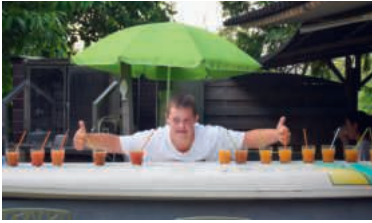
Insieme verbindet Menschen mit einer geistigen Beeinträchtigung.