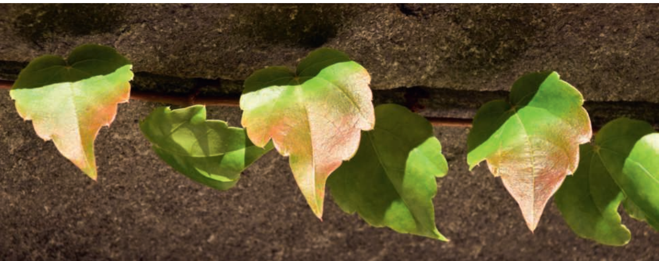
Efeublätter an einer Hausmauer im Centovalli | Bild: Sylvia Stam

W ir sind alle Blätter an einem Baum, keins dem anderen ähnlich – das eine symmetrisch, das andere nicht, und doch gleich wichtig dem Ganzen.