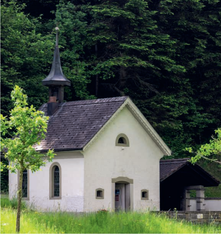
Beim Badbrünnli rechts von der Gnadenkapelle füllen Gläubige das Wasser flaschenweise ab.