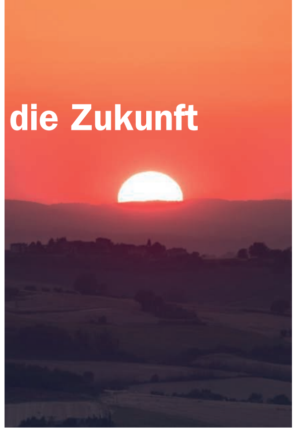
Sonnenuntergang in Umbrien, der Heimat von Franz von Assisi.

Im Jahr 2015 hat Papst Franziskus in seiner Enzyklika «Laudato si» die grosse Sorge um den Zustand von Gottes Schöpfung ausgedrückt. Darin zitiert er den Ökumenischen Patriarchen Bartholomäus, der mit unmissverständlichen Worten sagt: «Dass Menschen die biologische Vielfalt in der göttlichen Schöpfung zerstören; dass Menschen die Unversehrtheit der Erde zerstören, indem sie Klimawandel verursachen, indem sie die Erde von ihren natürlichen Wäldern entblößen oder ihre Feuchtgebiete zerstören; dass Menschen anderen Menschen Schaden zufügen und sie krankmachen, indem sie die Gewässer der Erde, ihren Boden und ihre Luft mit giftigen Substanzen verschmutzen – all das sind Sünden.» Denn «ein Verbrechen gegen die Natur zu begehen, ist eine Sünde gegen uns selbst und eine Sünde gegen Gott» («Laudato si» 8).