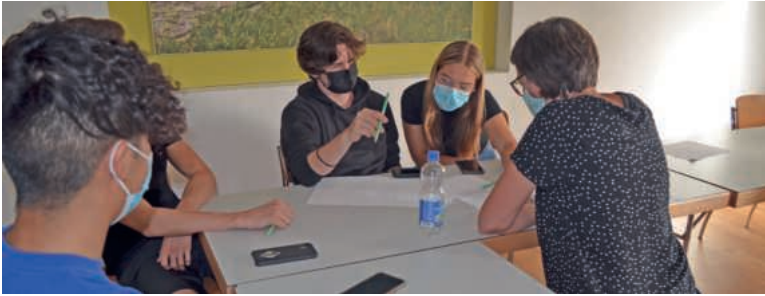
Auf dem Firmweg unterwegs.