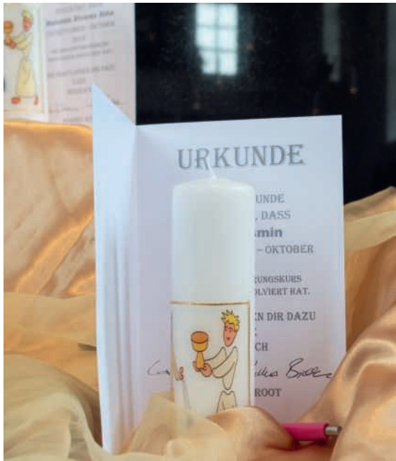
Mini-Kerze und Urkunde.