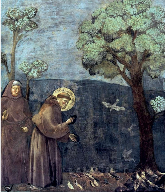
Heiliger Franz von Assisi: Fresko aus dem 13. Jahrhundert.