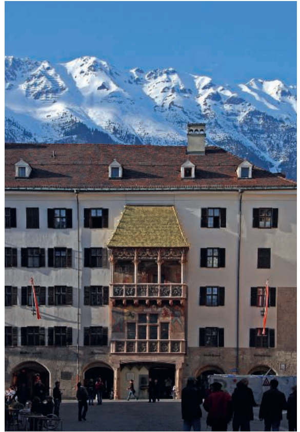
Goldenes Dachl in Innsbruck.